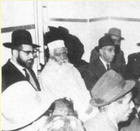
עם חכם עובדיה

מעשה בחכם אחד, שאשתו רצתה לעבוד כדי לסייע בנטל הפרנסה, אך לא מצאה עבודה טובה.